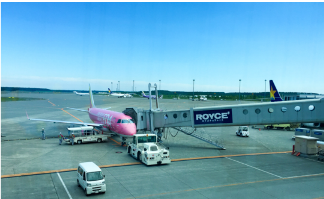
飛行機を降りて新千歳空港内のホテルフロントへ行きチェックインを済ませました。